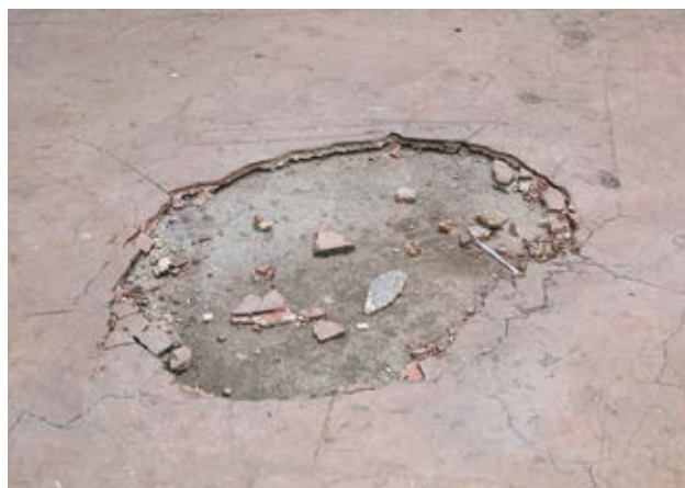
1 Pavimento in materiale composito a base di magnesite contenente amianto

Se si sospetta che la rimozione dei pavimenti in materiale composito possa causare un elevato rilascio di fibre nell'aria, prima di iniziare i lavori è necessario determinare con precisione questo rischio.