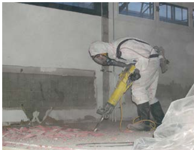
2 Pavimento rimosso con un martello demolitore