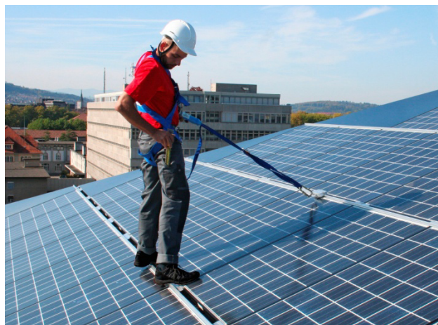
3 Impianto fotovoltaico moderno con dispositivo anticaduta integrato per i lavori di manutenzione e riparazione (da usare come sistema di trattenuta)

OPI (Ordinanza prevenzione infortuni) artt. 5, 8, 17