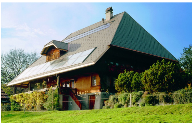
4 Un impianto solare richiede il rispetto di severi requisiti di sicurezza per quanto riguarda gli accessi e i dispositivi anticaduta.