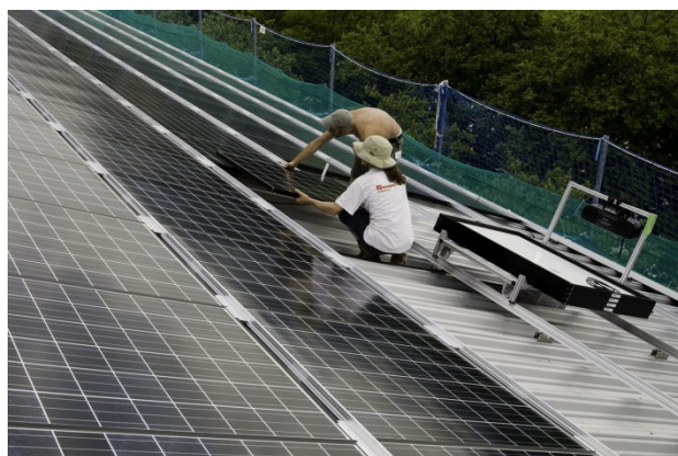
2 Il montaggio dei collettori deve avvenire solo con dispositivi di protezione collettiva (parete di ritenuta sul tetto, ponteggio con ponte da lattoniere, ecc.).