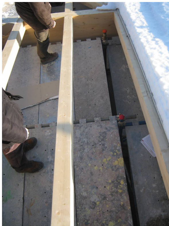
FOTO 1. Soluzione di sicurezza con installazione di sottoponte di sicurezza e con installazione di funghi protettivi quali “copri ferro” nella parte terminale del montante del ponteggio.