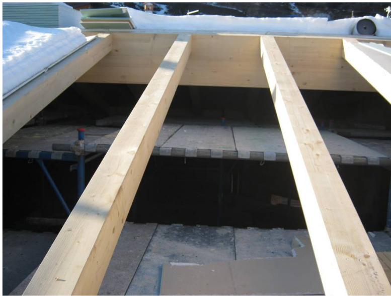
FOTO 2. Soluzione di sicurezza con installazione di sottoponte di sicurezza e con installazione di funghi protettivi quali “copri ferro” nella parte terminale del montante del ponteggio.