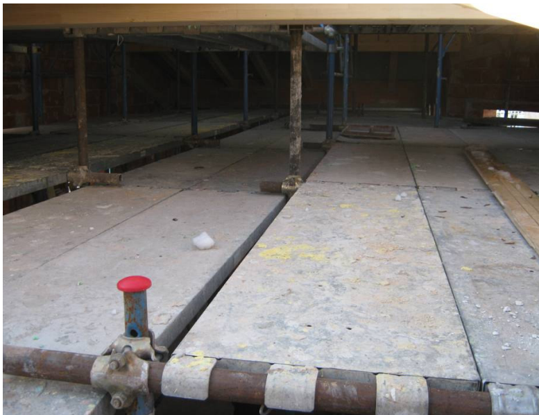
FOTO 3. Soluzione di sicurezza con installazione di sottoponte di sicurezza e con installazione di funghi protettivi quali “copri ferro” nella parte terminale del montante del ponteggio.